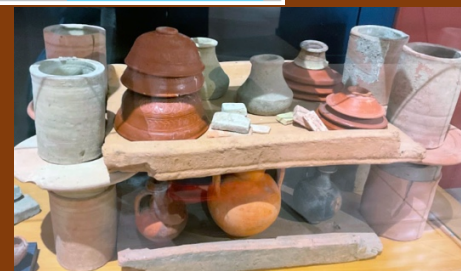
Evocation de production de vaisselle à Montans

CONTACT : Martine JOLY Martine.joly@univ-tlse2.fr